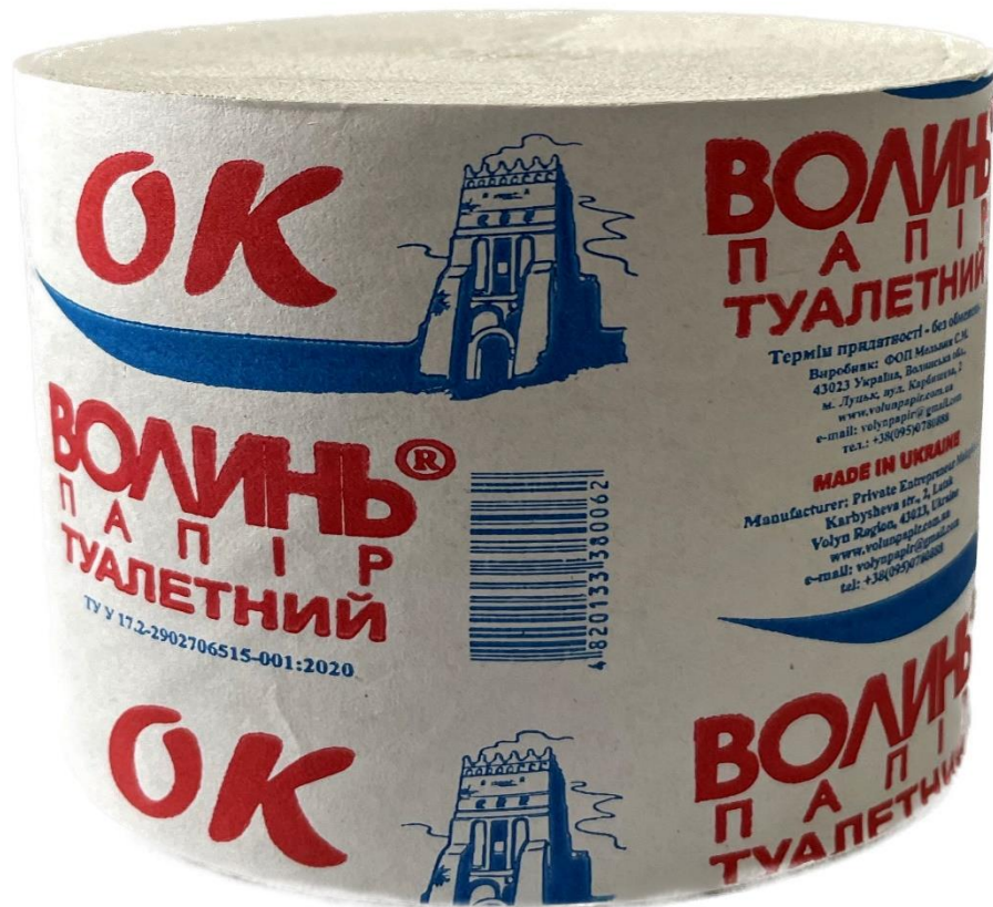
Фото 1 (Продукція 2)